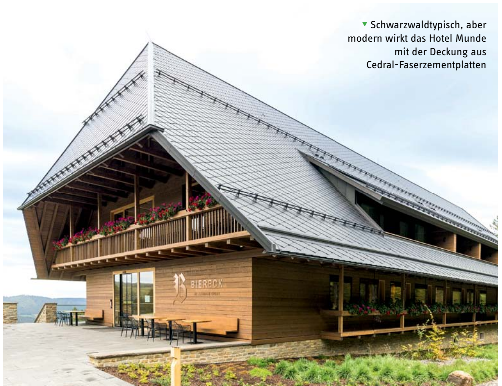
▼ Schwarzwaldtypisch, aber modern wirkt das Hotel Munde mit der Deckung aus Cedral-Faserzementplatten