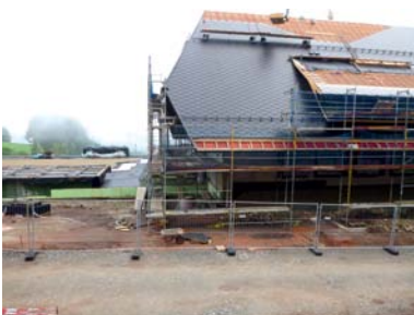
▲ Insgesamt 1260 m 2 Dachfläche wurden bei dem Bauvorhaben am Hauptgebäude gedeckt