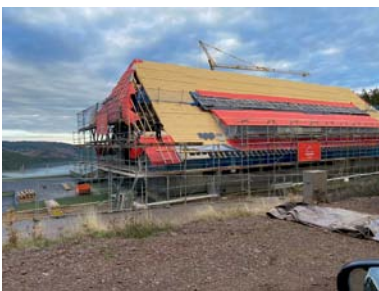
▲ Die Basis der Dachhaut bilden Holzfaserdämmplatten