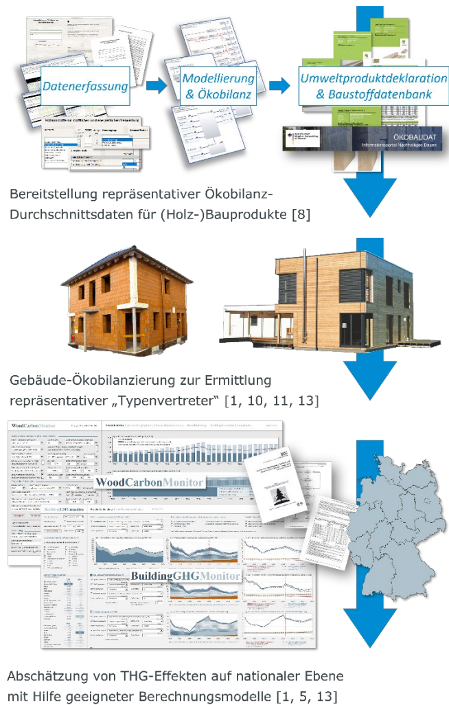
Abbildung 1: Informationsfluss zur Abschätzung des Beitrags von Holz in Gebäuden in der nationalen THG-Bilanz

Auf dieser Basis kann bereits der Beitrag der Holzverwendung in Gebäuden zur biogenen Kohlenstoffspeicherwirkung gemäß der THG-Berichterstattung abgebildet (vgl. 1.1) und die nicht-biogenen THG-Emissionen entlang der Verarbeitungskette des Rohstoffs bis hin zur Verwendung in Gebäuden ermittelt werden (IST-Zustand, vgl. 1.2).