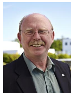
Willi Ernst Centrosolar Group AG DE-Paderborn