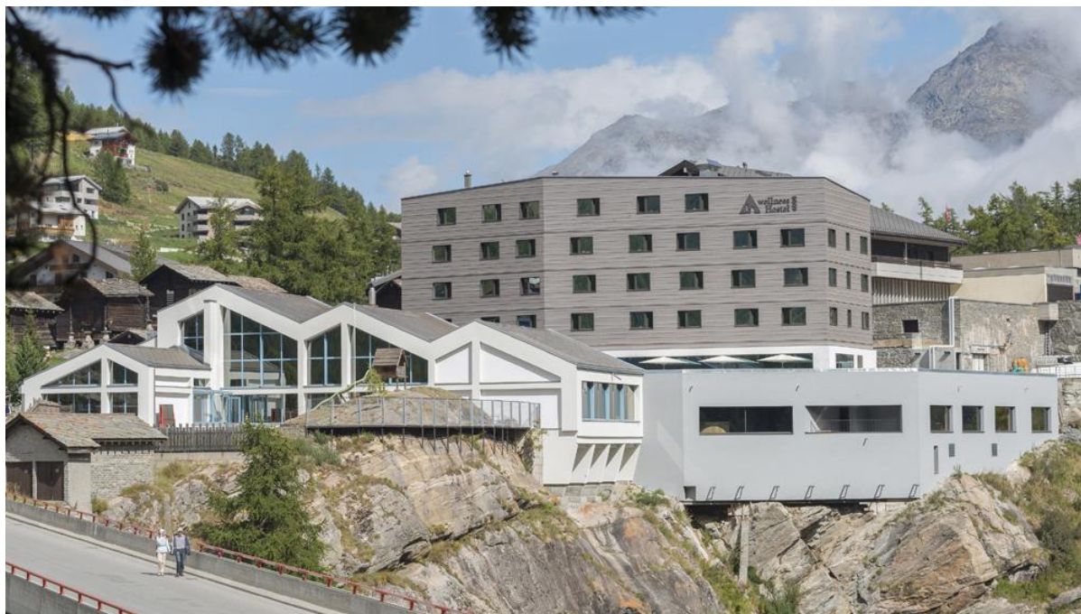
Abbildung 1: Die neue Generation 2015 der Schweizer Brandschutzvorschriften eröffnet Holz unter anderem grosse Chancen bei der Realisation von Beherbergungsbetrieben. Im Bild das <wellnessHotel4000> in Saas-Fee (Bauherrschaft: Schweizerische Stiftung für Sozialtourismus; Architektur: Steinmann & Schmid Architekten, Basel/Visp; Holzbau- und Brandschutzingenieur: Makiol + Wiederkehr, Beinwil a. S.; Fachingenieur Qualitätssicherung als Kontrollorgan: Josef Kolb AG, Romanshorn). Die im September 2014 eröffnete, topmoderne Jugendherberge schöpft als fünfgeschossiger Hotel-Holzbau die neuen Möglichkeiten für Holz als Pilot- und Pionierprojekt aus.

Mit der Vorschriftengeneration BSV 2003 wurde eine Öffnung für die Holzanwendung am Bau vollzogen. Holzbauten bis 6 Geschosse sind für die Nutzung Wohnen, Schule, Büro seit 2005 möglich. Die neue Vorschriftengeneration BSV 2015 setzt diesen Weg konsequent fort und beseitigt aufgrund der positiven Erfahrungen in den letzten 10 Jahren die noch bestehenden Einschränkungen für die Holzanwendung. Zukünftig können Holzbauteile in allen Gebäudekategorien und Nutzungen eingesetzt werden. Bei der Definition des Feuerwiderstandes wird eine Konstruktion mit brennbaren Anteilen den nicht brennbaren Bauteilen gleichgestellt. Die Anwendungsmöglichkeiten für das Holz werden damit deutlich erweitert.